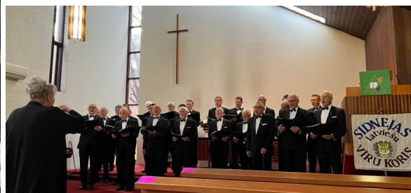
SLVK pēdējā dziesma.....