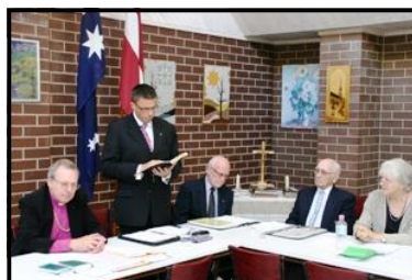
Prāvests atklāj Sinodi.