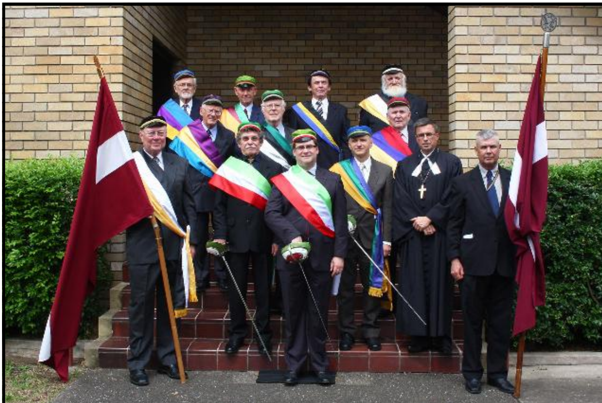
Kalpaka piemiņas dievkalpojums, 2010.g.7.martā.

Gaišus un priecīgus Kristus Augšāmcelšanās svētkus visiem vēl draudzes mācītājs, padome un dāmu komiteja!