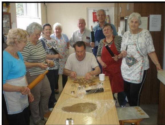
Piparkūku talkas strādnieki!

Dz.gr.87. autors nezināms, atdzejojis Hans Kristel Glaeser