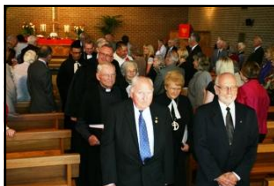
Gājiens pēc dievkalpojuma